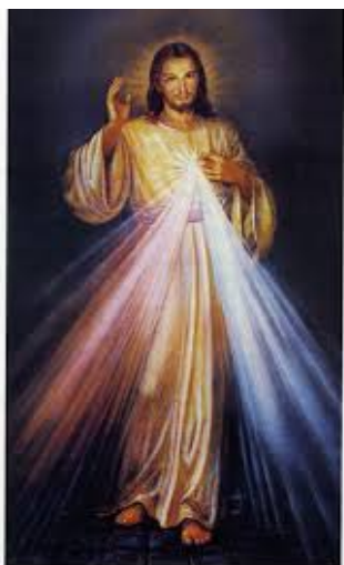
JESUS, J'AI CONFIANCE EN VOUS !

La seconde encyclique de JPII concernera la miséricorde 2 , thème qui lui était cher et qu'il va développer et vivre tout son pontificat. Nous pouvons mettre en lumière deux faits qui illustrent ce désir de faire saisir en profondeur cette miséricorde divine :